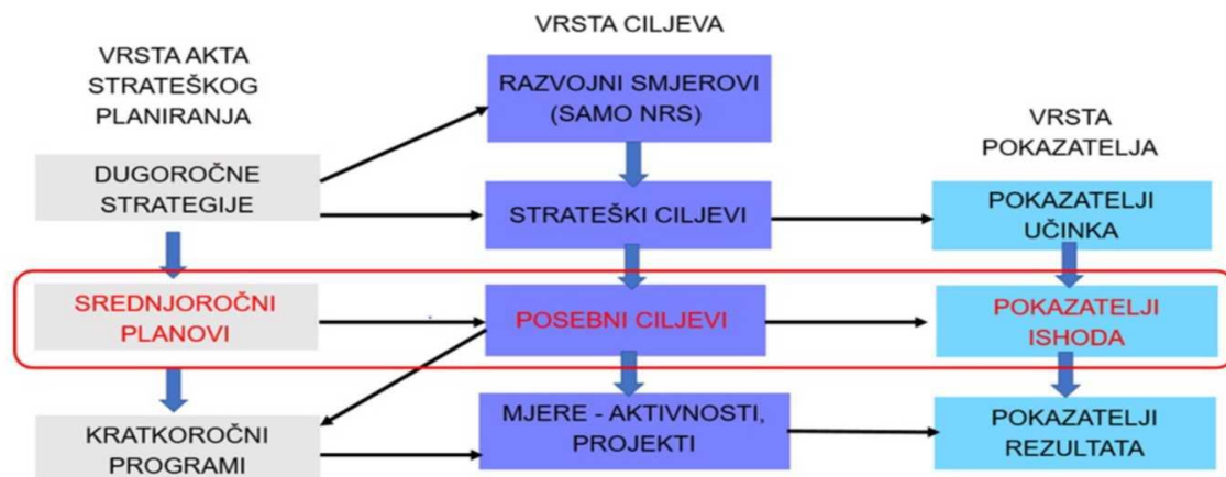
Slika 1. Komponente i poveznica logičkog okvira strateškog planiranja

Plan razvoja Požeško-slavonske županije usklađen je sa zakonodavnim i strateškim okvirom na razini Republike Hrvatske. Planovi razvoja zamjenjuju županijske razvojne strategije koje su se donosile u prethodnom razdoblju temeljem Zakona o regionalnom razvoju.